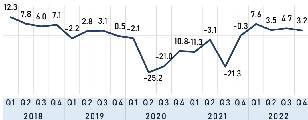
Exhibit II: Net Balance of Business Performance Expectation for Upcoming Six Months, Malaysia, 2019 – 2023