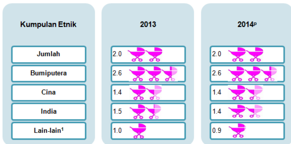
Carta 1: Kadar kesuburan jumlah mengikut kumpulan etnik, Malaysia, 2013 dan 2014 P

Analisis menunjukkan kadar kesuburan jumlah berada di bawah paras penggantian iaitu tidak berubah pada kadar 2.0 bagi setiap perempuan berumur 15–49 tahun dari 2013 ke 2014. Kadar kesuburan menunjukkan penurunan bagi etnik India dan Lain-lain manakala etnik Bumiputera dan Cina tidak berubah pada kadar 2.6 dan 1.4 dalam tempoh yang sama. Pada 2014, kadar kesuburan bagi etnik Bumiputera adalah 2.6 bagi setiap perempuan berumur 15–49 tahun, di atas paras penggantian. Ini bererti purata 2.6 bayi dilahirkan bagi setiap wanita Bumiputera yang dalam lingkungan umur reproduktifnya (15–49 tahun). Sebaliknya, kadar kesuburan bagi etnik Cina dan India adalah sama iaitu pada kadar 1.4 dan Lain-lain pada kadar 0.9 bagi setiap perempuan berumur 15–49 tahun, di bawah paras penggantian (Carta 1).